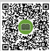
สแกนเพื่อดาวน์โหลดคู่มือการใช้งาน Application IR PLUS AGM (ภาษาไทย)