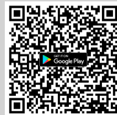
สแกนเพื่อดาวน์โหลด Application IR PLUS AGM ระบบ ANDROID เวอร์ชัน 7 ขึ้นไป