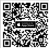
สแกนเพื่อดาวน์โหลด Application IR PLUS AGM ระบบ iOS เวอร์ชัน 13.6 ขึ้นไป

ในวันประชุม ผู้ถือหุ้นเข้าสู่ Application IR PLUS AGM และใส่รหัส Pincode เพื่อลงทะเบียนเข้าร่วมประชุม