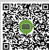
สแกนเพื่อดาวน์โหลดคู่มือการใช้งาน Application IR PLUS AGM (Eng ver.)