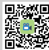
สแกนเพื่อดาวน์โหลดวีดีโอการใช้งาน Application IR PLUS AGM